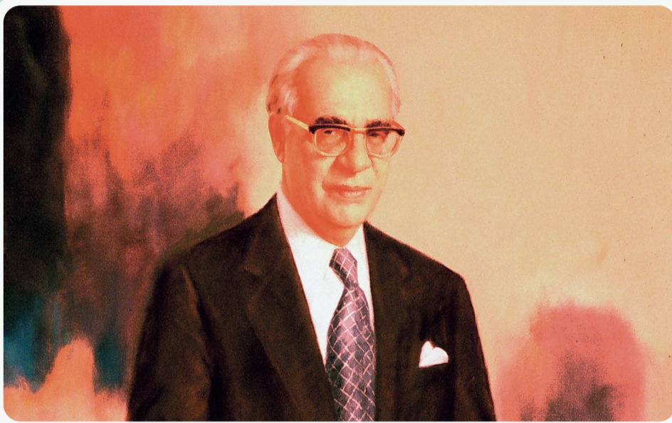
Έργο του Μ. Βαφειάδη. Καλλιτεχνική συλλογή της Εθνικής Τράπεζας